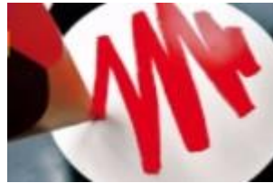
Nieuws uit het land

Samen met een aantal andere gemeentes zijn wij, als gemeente Berg en Dal aangesloten bij het Werkbedrijf Regio Nijmegen, dat voor ons probeert