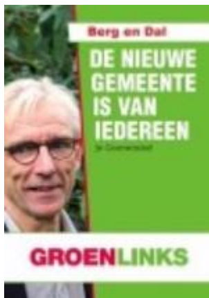
Nieuws uit Gelderland Berg en Dal