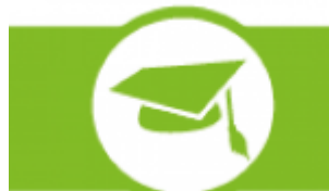
Nieuws uit het land