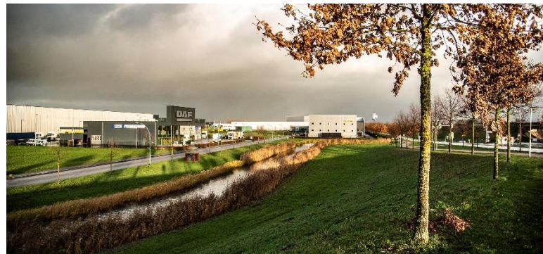
Bedrijventerrein bij Tiel, Rivierenland.

De land- en tuinbouw is een belangrijke economische factor in onze provincie, maar ook een sector waar veel bedrijven nog schadelijk zijn voor lucht, bodem, water en dieren. Zo produceert de Food Valley bijvoorbeeld het grootste mestoverschot van Nederland en verschromen de landschappen en biodiversiteit in o.a. de Achterhoek in hoog tempo. Een aanpak richting natuur-inclusieve kringlooplandbouw en vermindering van de veestapel is essentieel om tot verbetering te komen. Hoe we dat willen realiseren, leest u in het hoofdstuk over natuur-inclusieve en diervriendelijke landbouw.