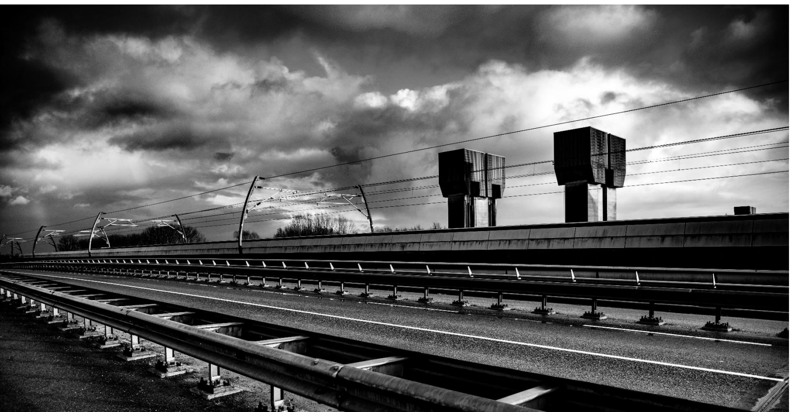
A15, Betuwelijn en Prins Bernardsluizen, bij Tiel.