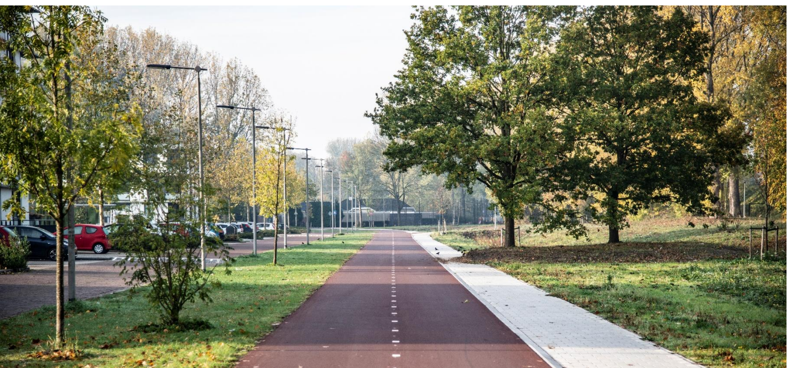
Fietssnelweg bij Arnhem.