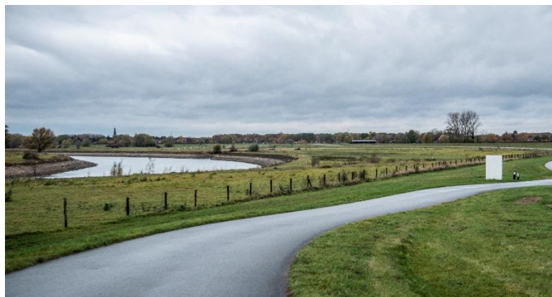
Slingerende IJssel bij Brummen

De Europese normen voor waterkwaliteit wil GroenLinks al in 2021 halen. Dat is zes jaar eerder dan het huidige beleid. Deze normen zijn van toepassing op alle wateren in Gelderland, niet alleen op de wateren die staan op de beperkte lijst van de Kaderrichtlijn Water. De provincie en de waterschappen werken samen om te voorkomen dat schadelijke medicijnresten, pesticiden en microplastics via de afvalwaterzuivering in het grond- en oppervlaktewater komen. Waterschap Vallei en Eem bouwt nu een proefinstallatie om medicijnresten uit het rioolwater te halen. Om te voorkomen dat er te veel meststoffen en pesticiden in onze watersystemen komen is het noodzakelijk om bufferzones bij landbouwgebieden in te stellen.