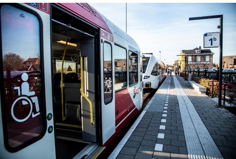
Rolstoelvriendelijke trein bij Winterswijk.