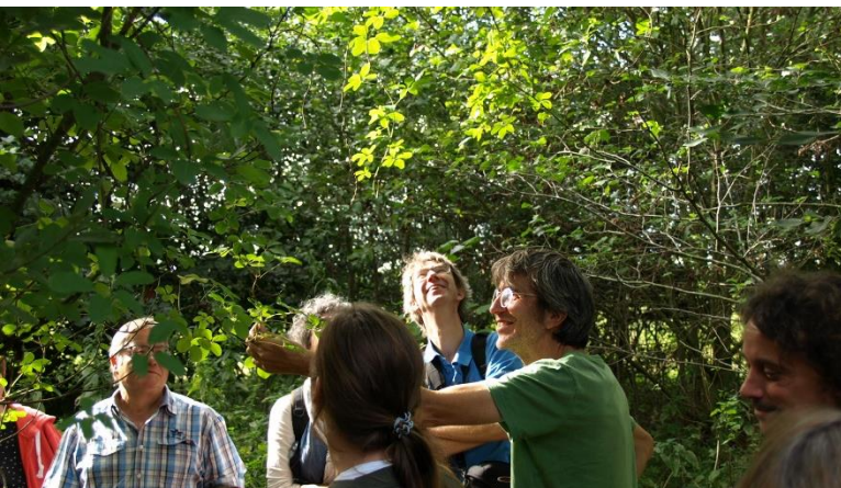
Voedselbos Ketelbroek bij Groesbeek.

Natuur-inclusieve kringlooplandbouw laat nog steeds ruimte voor een moderne bedrijfsvoering op een behoorlijke schaalgrootte.