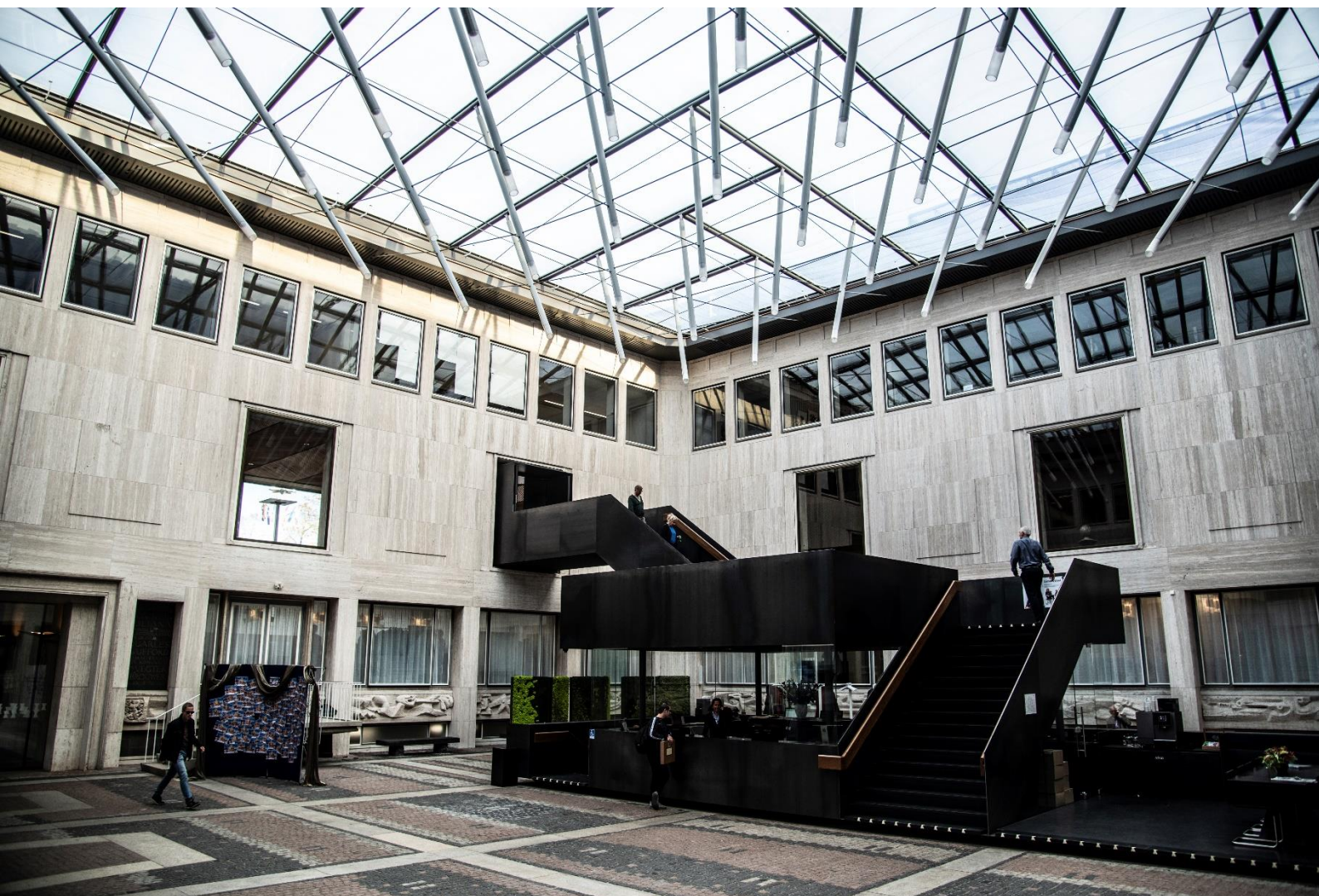
Huis der provincie, Arnhem