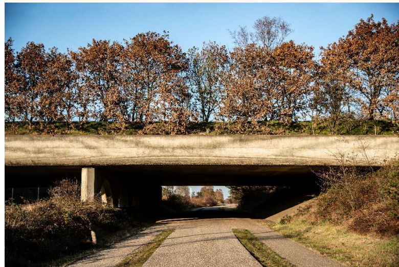
Wildwissel bij Terlet.

Bedrijfschade door in het wild levende dieren is géén reden voor jacht. Vaak zijn binnen de normale bedrijfsvoering en beheer voldoende maatregelen denkbaar om schade door deze dieren te voorkomen. In uitzonderingsgevallen is het beter en goedkoper om een schadevergoeding toe te kennen.